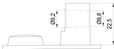
EUT (embedded universal terminal)